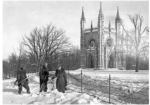
Немецкие солдаты возле Готической капеллы в парке Александрия Зима 1942