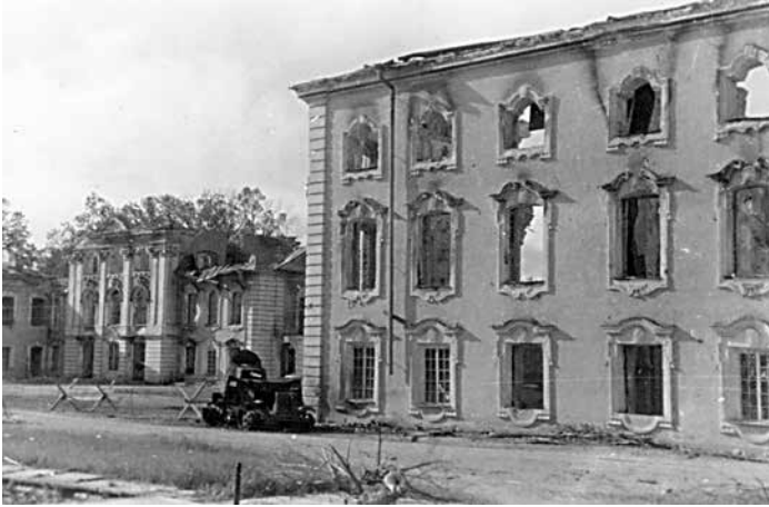
Южный фасад Большого дворца в Петергофе