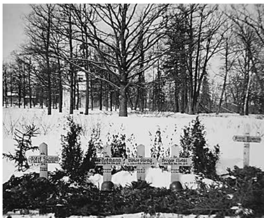
Немецкое военное кладбище в парке Александрия Март 1942