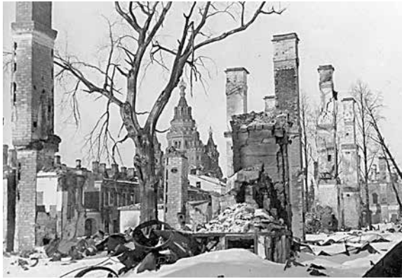
Вид на собор св. Петра и Павла в Петергофе