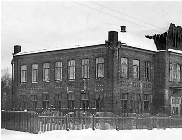
Здание Республиканского научного музея Прикамского края, г. Сарапул 1940-е