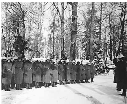
Шеренга немецких солдат в парке Александрия Март 1942