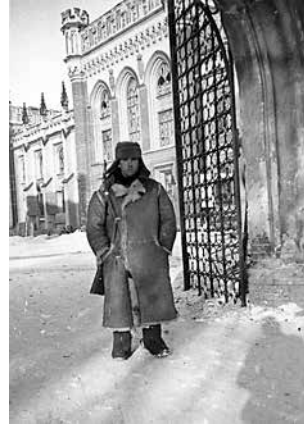
Немецкий часовой возле Готических конюшен