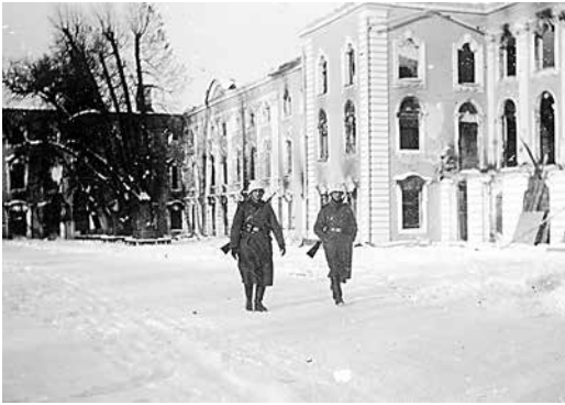
Немецкие солдаты у южного фасада Большого дворца. Вид на Корпус под Гербом Зима 1942