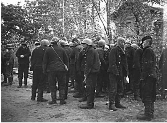
Пленные моряки-десантники возле Нижней дачи в парке Александрия.