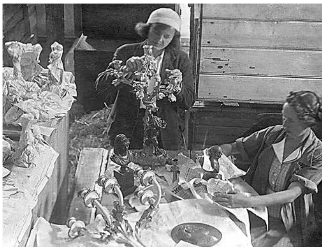
Работа по переупаковке экспонатов в Музее-хранилище ленинградских дворцов в Сарапуле