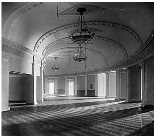
Кольцевое фойе Новосибирского театра оперы и балета. 1-й и 2-й этажи 1940