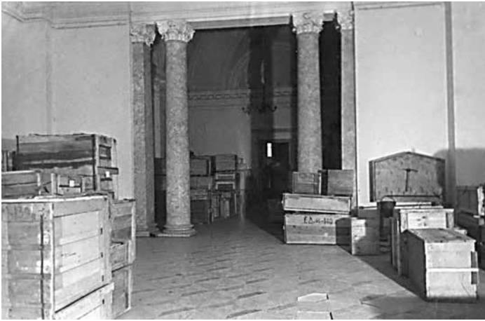
Центральное хранилище музейных фондов в Александровском дворце, г. Пушкин 1947