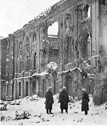
Немецкие солдаты у северного фасада разрушенного Большого дворца