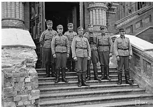
Личный состав финского наблюдательного поста на ступенях собора Св. Петра и Павла в Петергофе Июнь 1942